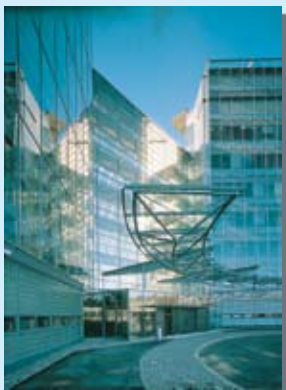
Julksivuteko -palkinto 1997 NokianKeilaniemen toimitalon kaksoisjulkisivulle