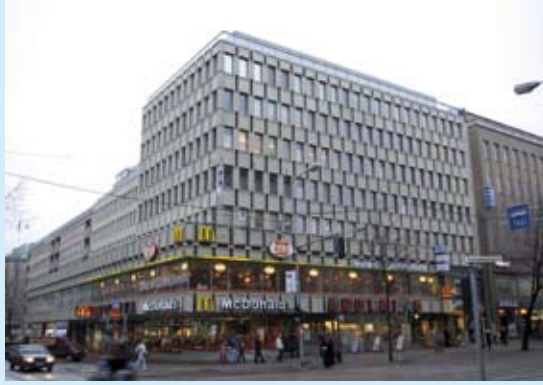
Kiinteistö Oy Kauppa Tammer, Hämeenkatu 5, Tampere ennen julkisivusaneerausta (vasemmalla) ja saneerauksen jälkeen (oikealla).