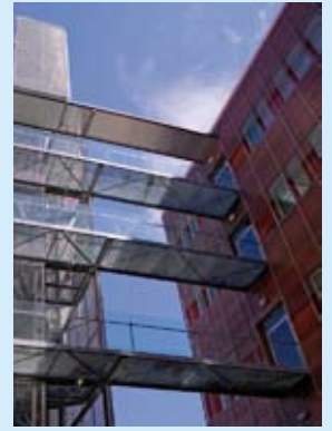
Metla-Talo Joensuu.