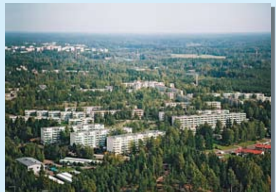
Julksivuteko -palkinto 2004 Helsingin Jakomäen mittaville ja hallituille julkisivukorjauksille.